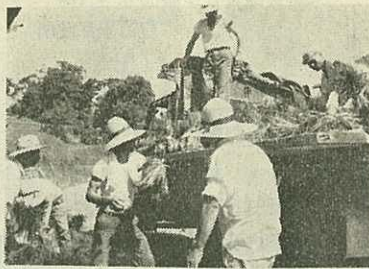
佐賀市へ送る救援苗の積み込み