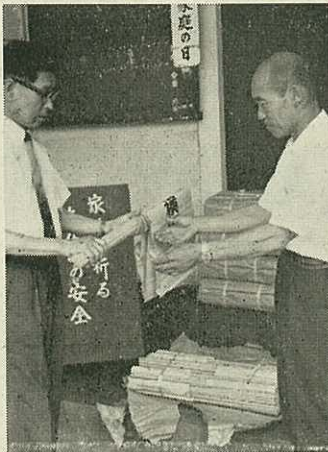
横断旗を贈る川久保課長(左)