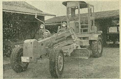
道路補修に活躍するグレーダー

◆「間」のおきかたにあるといわれる。話術は「間」の芸術ともいわれるくらいで、適切な句切りと適当な間隔が、その話を生かしてくる。