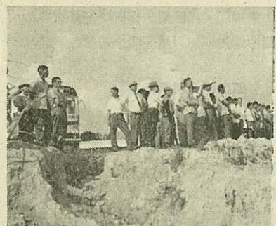
立花台地と坂口台地を視察する駐在員会

◎相手の電話がダイヤル式でないところへかけるときは、店の「きりかえ」かぎを使ってください。10円玉を入れてダイヤルしても、あなたの声は相手に聞えません。