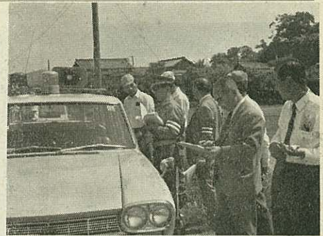
ここにはガードレールを・南波多町で