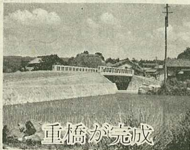
完成した重橋と取付道路

南波多町の市道重橋〜木場線の重橋が完成しました。この橋は42年災害で石橋が流出、災害復旧と道路改良事業で施行しました。