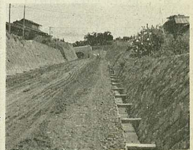
開通した黒川バイパス

総事業費1,007万円・長さ21メートル・幅5.5メートルの鉄筋コンクリート橋です。取付道路75メートルと河川36メートルの改修もできました。