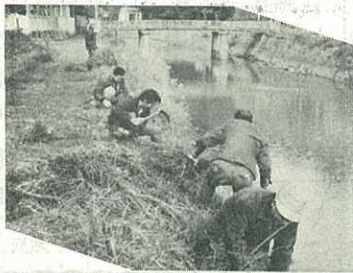
奉仕作業をする青年会議所会員