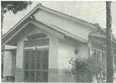
【写真】完成した祇園町公民分館