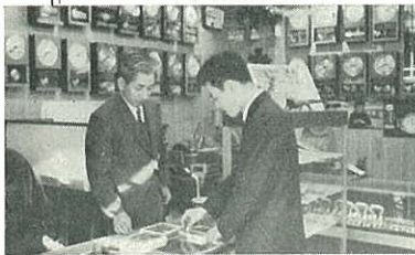
【写真】市長賞をうけた徳田時計店

日本商工会議所会頭賞 かわら文具店 徳田時計店・市長賞 キタムラ 県商工会議所連合会长賞 早田商店 伊万里商工会議所会頭賞 さのや菓子舗・伊万里商店街連合会长賞 寿屋洋服店