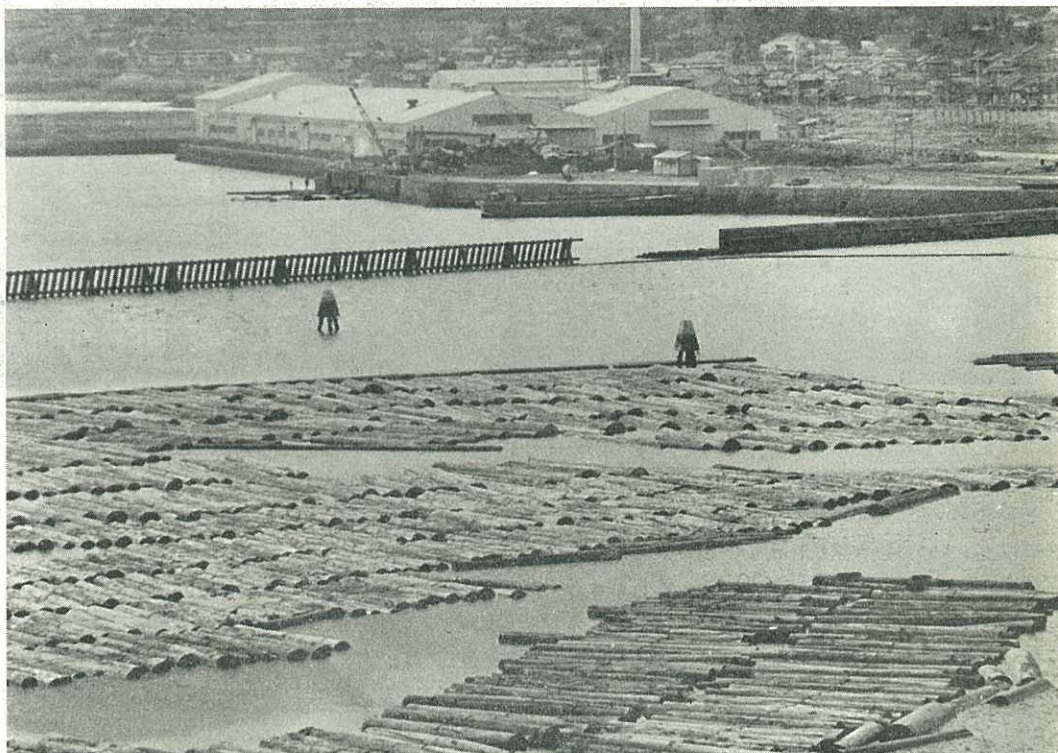
（久原小島から貯木場を写す）