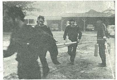
【写真】消防訓練での負傷者救助