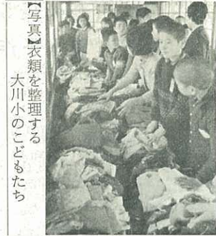
【写真】衣類を整理する大川小のこどもたち

衣類は、佐賀のみどり園・めぐみ園・春日園・くろかみ学園・市内母子寮などへ12月13日発送されました