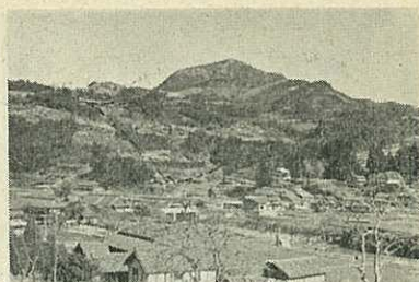
地すべり防止工事がなされる北野区

基盤整備のための林道も、波多津大川・黒川・南波多に延べ2,900メートル（工事費1,170万円）建設されます。