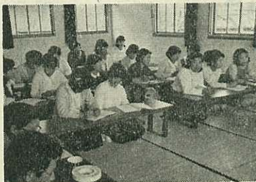
南波多家政学院開設式で