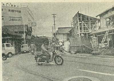
道路拡張が始まった玉屋前