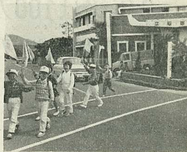
上級生が作った旗をもって渡る生徒

伊万里警察署長さんは、男性の多いわたくしたちのような職場では非常にありがたい。さっそく各課に配ばって使わせてもらっていると喜んでおられます。