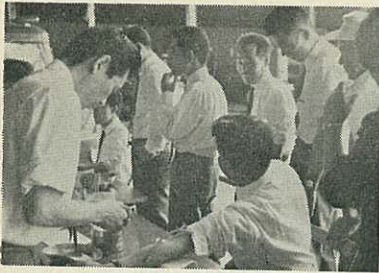
献血する市役所職員

このことから、受診していない市民のなかには相当数の患者がいるものとみて、こしは一般住民検診の徹底を図ることにしています。