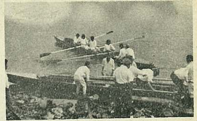
【写真】練習する伊商高ボート部