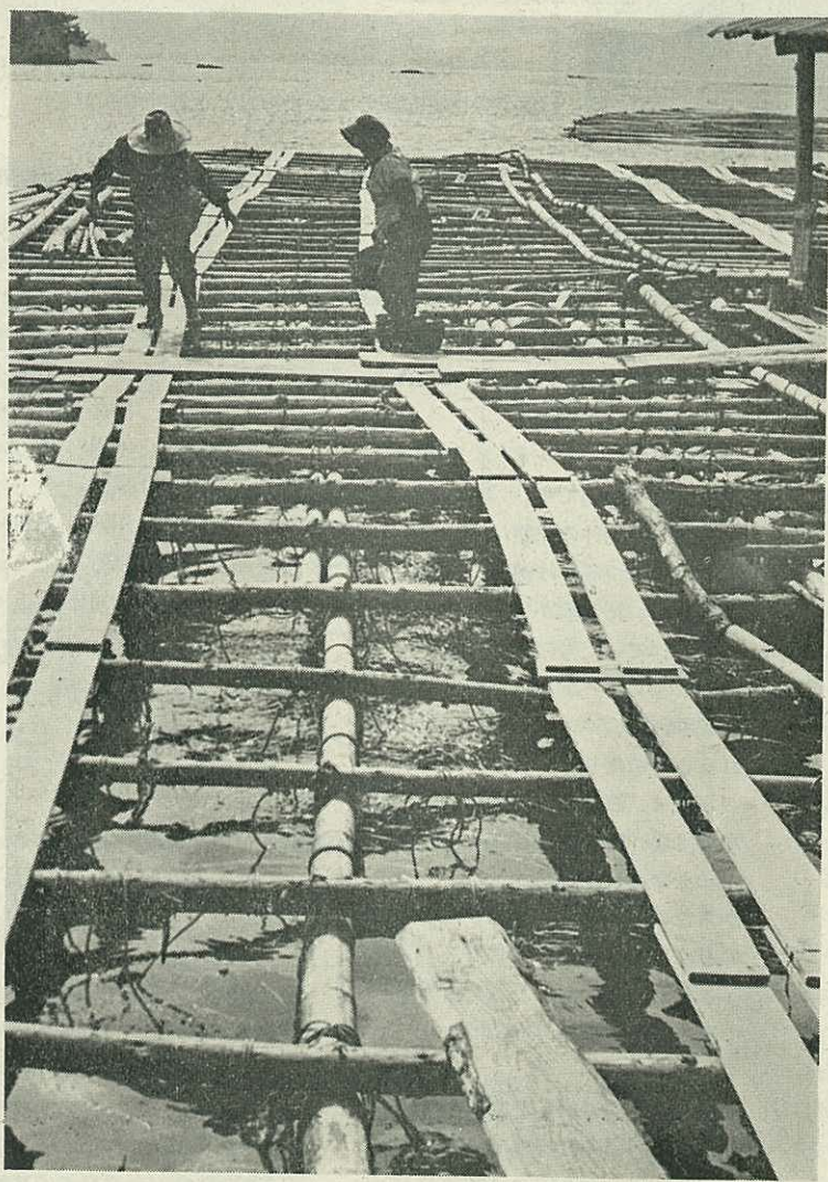
(S41・5・9 黒川町渡辺真珠養殖所で写す)

昭和29年8月19日 第3種郵便物認可 ○ 毎月1日発行 昭和41年6月1日 伊万里市役所総務課発行 No. 146