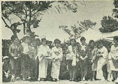
【写真】勢ぞろいしたミスつつじたち