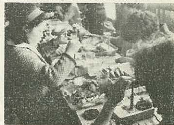
講習会での核入れ実習

昨年は、波多津町から新人が国立大村真珠研究所に派遣され技術を身につけて帰り、いま養殖事業と取り組んでおられます。