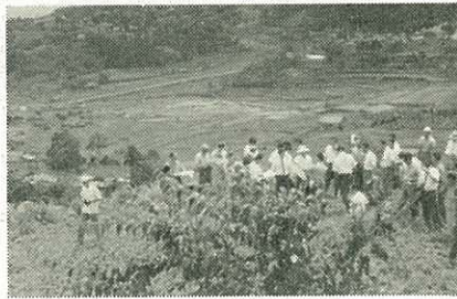
【防災会議の現地調査】

亀裂の大きさは、人形石山中腹200メートルに幅150メートル・長さ350メートルです。もし地すべりがおこれば、家屋12戸・耕地10ヘクタールが埋没するおそれがあり、楽観できない状況にあります。