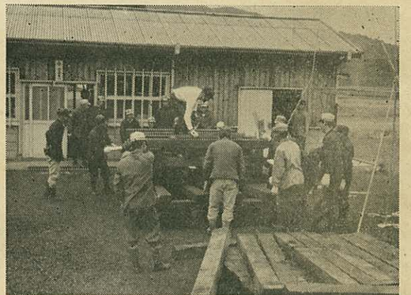
(マクラギサンドル工、実地訓練)