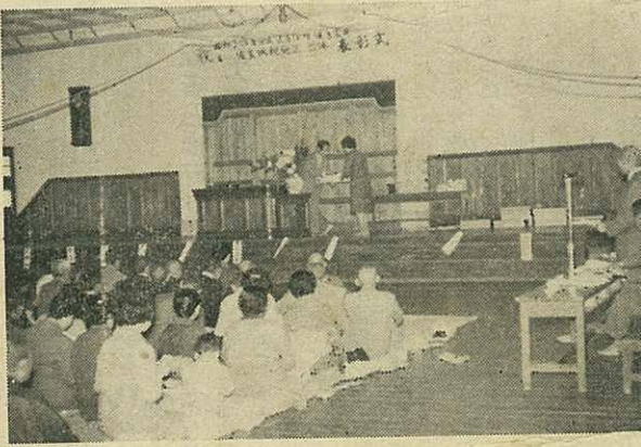
大坪小での表彰式

医師の診断書をお持ちになつて申出ください。 その後の異動についてはすみやかに手続きされるようお願いいたします。