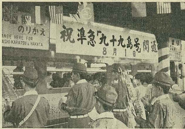
【伊万里駅での歓迎風景】