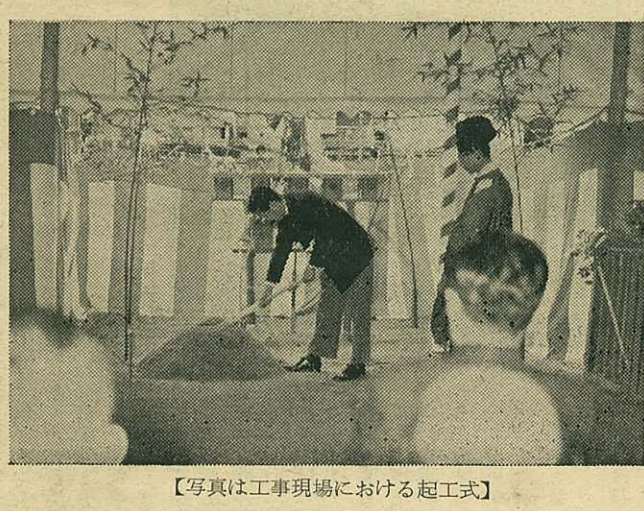
【写真は工事現場における起工式】