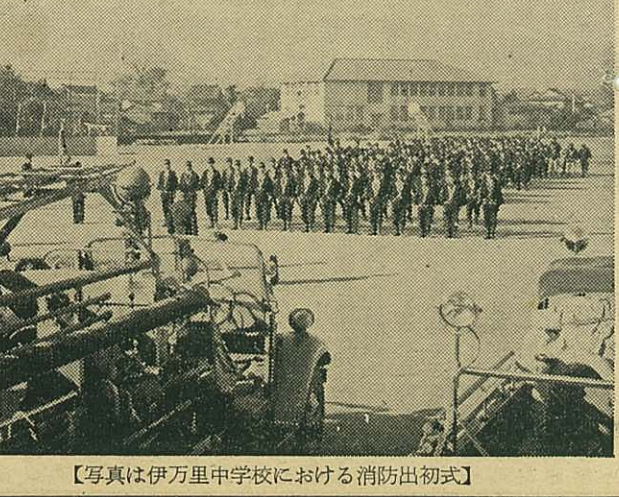
【写真は伊万里中学校における消防出初式】