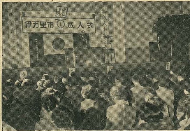
写真は伊万里小学校における成人式

社会人としての門出を祝う成人式は、各町とも公民館、婦人会、青年団が中心となり、講演会、映画会、演劇、舞踊或は卓球や駅伝競走など、色とりどりの催しが行われ晴れの前途を祝福した。該町は男子五八九名、女子六八八名、計一二五七名及び、市からは記念の鏡が贈られた。 なお、これに先だち大川、波多津の両町では、特に十日成人者ばかりの特別学級が設けられ、映画会や講演会を開催、社会人としての心構えについて、ジックリ一日の講習が行われた。