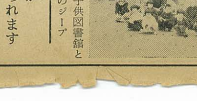
写真は日南郷子供図書館となつた市役所のジープ