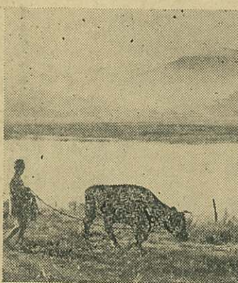
伊万里市街南面に