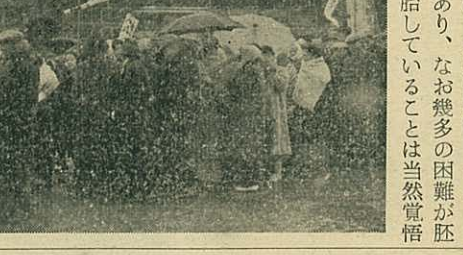
写真 (下) 伊万里駅前集合した沿線住民

しなればなりません。われわれはより強固な意志と團結を以て相次で陳情を行う覚悟と熱意が肝要かと存するのであります。各位のより一層の熱意と一致團結による御支援、御協力を信じ、所期目的達成の一日も速からんことを祈り以上所信を申述べ御挨拶と致します。