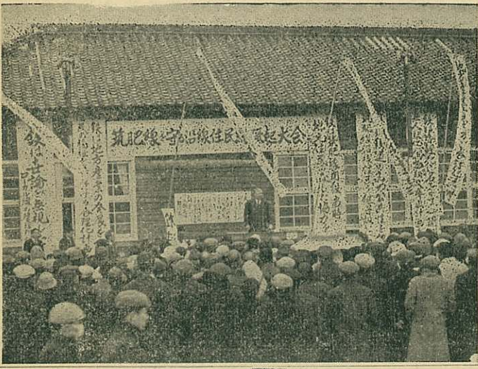
写真 (上) は市役所広場における大会 (中) 吹雪をういて市中行進する一行 (下) 伊万里駅前集合した沿線住民