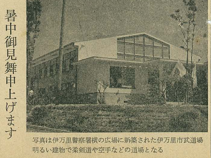
写真は伊万里警察署横の広場に新築された伊万里市武道場 明るい建物で柔剣道や空手などの道場となる

虚礼廢止 中元の贈答に無理はないか お互いのためにこの際思 切つて無駄を省こう。 新生活運動