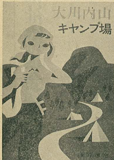
大川内山 キャンプ場

待望の大川内キャンプ村は さる四日から始まり、新築 の小屋も増設、梅雨明け の盛況が予想されている。 また二十四日には書道大会 二十九日にはスケッチ大会 も実施される予定、なお年 々盛んになっている楠久の 海水浴場では、本日から 開設、距離も近く子供づれ の一日行楽には恰好の地 あり、賑わいが予想される。