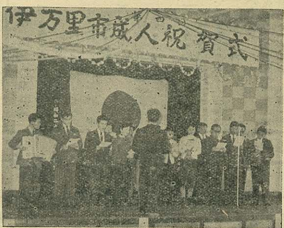
大人となる日! (写真は伊万里町の祝賀式)

お願い 市政について 投書下さる方は回答に困りますので必ず住所氏名をお書き添え願います。