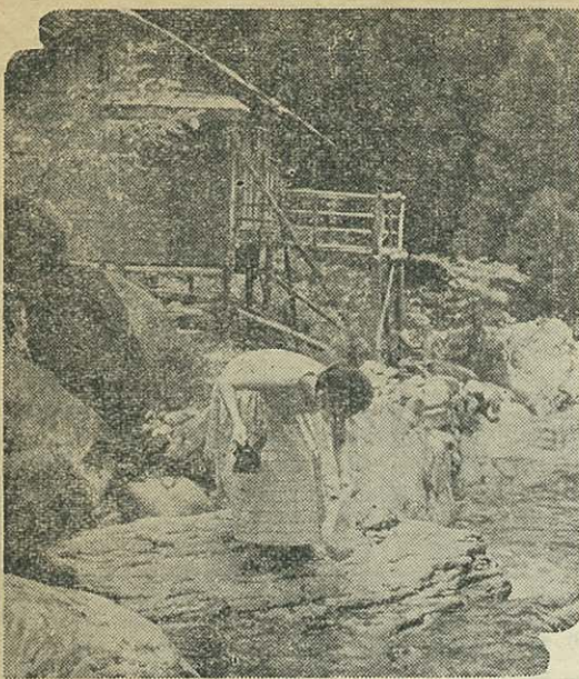
(写真は河鹿なく清流大川内山キャンプ村)

七年目を迎える 住民登録制度 市の現在人口は八三、九七六八 市役所の窓口で市民の皆さんに、一ぱん関係の深い住民登録制度が出来てから六周年を迎えました。職を求めるとき、履歴書や不動産の登記その他あらゆる取引、手続等の書類には、所在を明らかにするたに住所を書き入れます。私はどこに住んでいるのか、私に住所があるのは何町の何番地だということを公証してくれるのがこの制度であります。