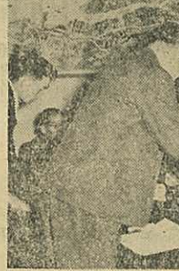
国見子供クラブ 中学生四名、小学生三四 名からなるこのクラブは、 毎月第一日曜を反省会とし て、お互いの研修を行つて いる、そのため学校の出席 予定がたてら れる、毎月二 回公民館で開 催、今年度は 特に「カ」と エのいな住 みよい部落を つくりましよ う」を努力目 標として、婦 人会に協力し ている。

市の青少年問題協議会で は、くれの十五日市役所に おいて、昭和三十一年最後 の協議会をひらき、次の二 つの子供クラブと六名の優 良青少年の表彰を行った。