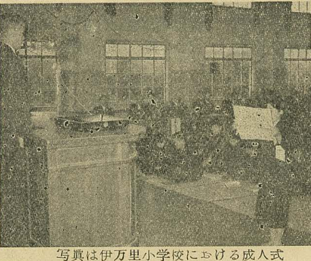
写真は伊万里小学校における成人式