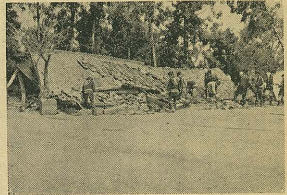
道路決壊 七ヶ所 船舶の被害 三隻 (写真は災害の一部)

超えるものと予想され、尚開拓地の被害甚しく、市で 全半壊 八一 非住家の全壊 一一 全半壊 六一 床下浸水 一〇 冠水田 二四町歩