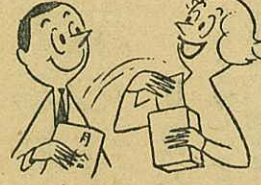
収入のいくらかを天引して...